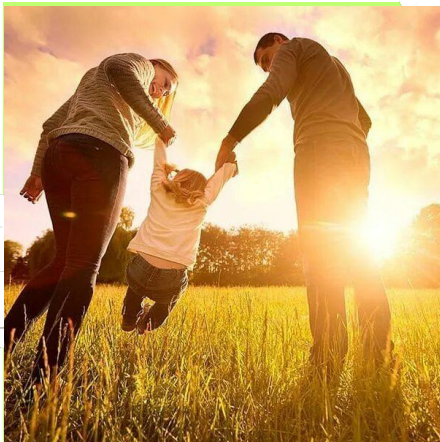
День семьи (15 мая)