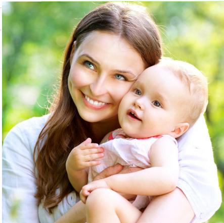
День матери (14 октября)