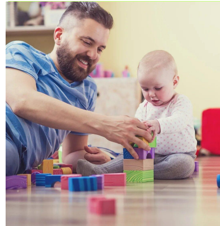
День отца (21 октября)